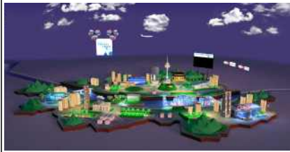
[버추얼 서울 2.0 메인 로비]